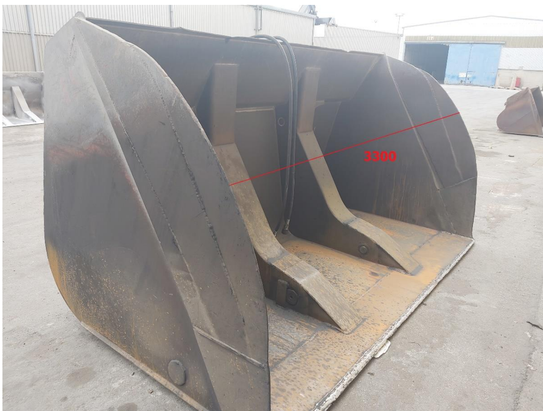
Slika 3: Širina žlice visokega izstresa