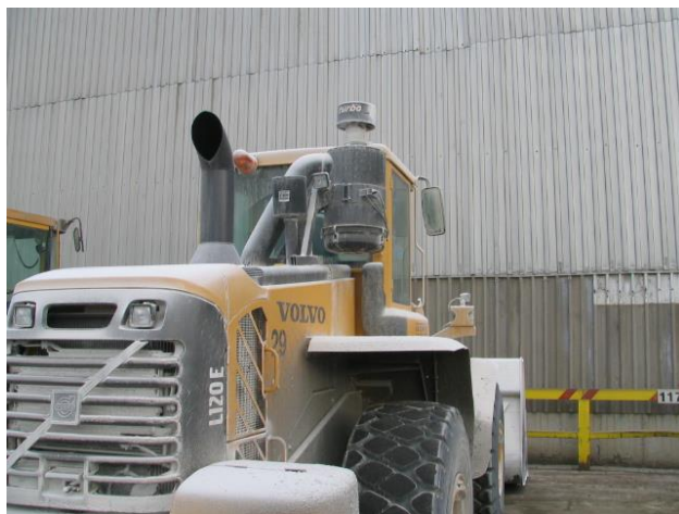
Napačna postavitev filtra.

Filter zraka, ne sme biti postavljen previsoko, ker ovira preglednost iz vozila. Najboljša pozicija, je na blatniku vozila, kar je razvidno iz priloženih slik.