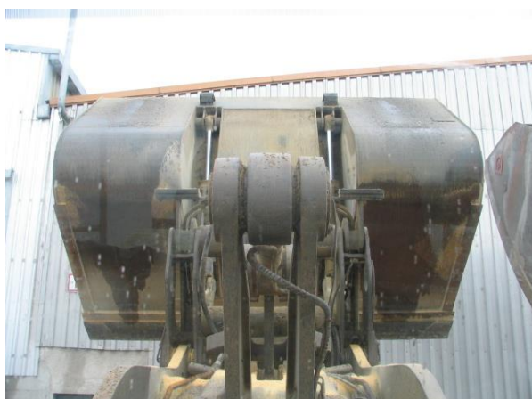
Star model žlice – bistveno večja Preglednost, šofer vidi nož žlice USTREZEN MODEL