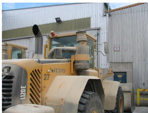
Pravilna postavitev filtra – TAKO NAJ BO POSTAVLJEN