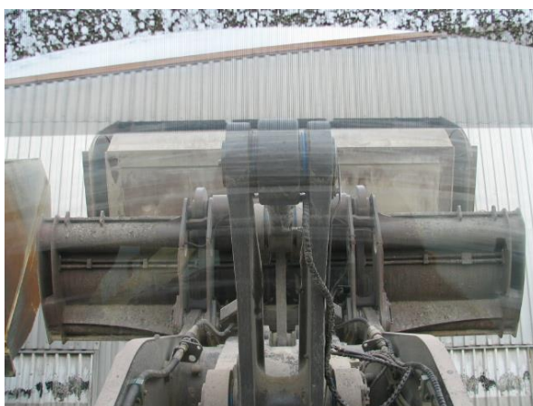
Nov model žlice, kjer je preglednost bistveno slabša, šofer ne vidi noža žlice NEUSTREZEN MODEL