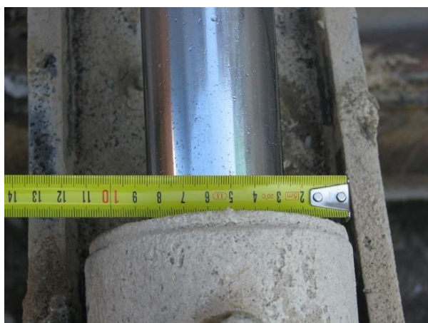
NAPAČEN – poddimenzioniran iztresni cilinder žlice