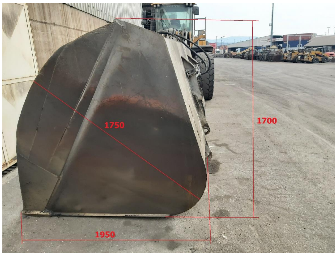
Slika 2: Dimenzije žlice visokega iztresa

Priporočamo ogled obstoječih žlic na terminalu sipkih tovorov v Luki Koper, kjer lahko izmerite in pridobite vse potrebne mere in tehnične lastnosti za izdelavo identične žlice.