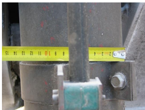
PRAVILEN – močnejši iztresni cilinder žlice